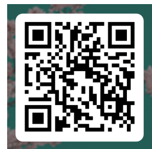
回答フォーム QRコード